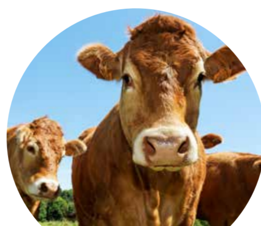
ŻYWIEC WOŁOWY (bez cieląt)

o 42,5% więcej niż w tym samym okresie roku poprzedniego